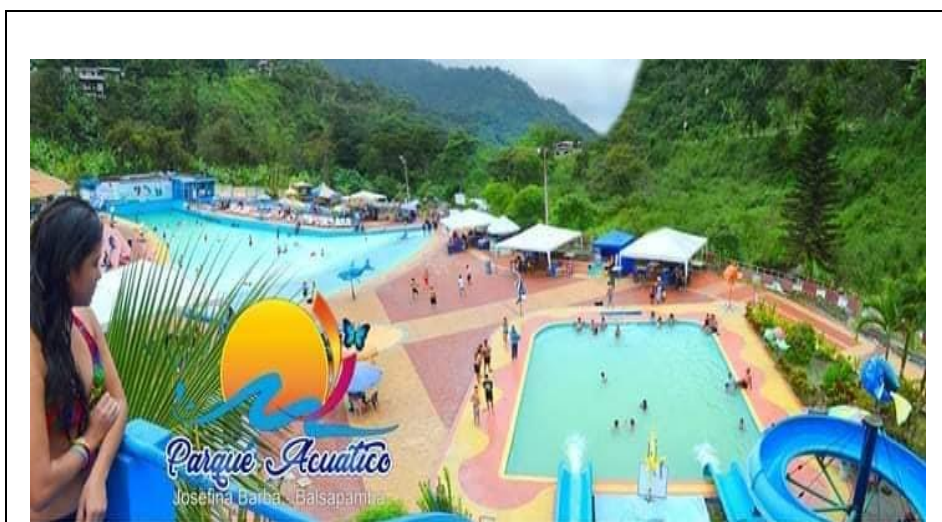
Figura N° 1 Parque Acuático Josefina Barba

El Parque Acuático Josefina Barba.- Se encuentra localizado en la parroquia Balsapamba, sector El Cristal, a 59 km de Guaranda, tiene capacidad para 3.000 personas. Sus atractivos principales son: la piscina de olas, toboganes, sauna, turco, hidromasaje, piscina para niños y niñas, juegos recreativos, bar restaurant, vestidores, tiendas para venta de artesanías, trajes de baño, cancha de Voleibol de playa, áreas verdes, baterías sanitarias y servicio de salvavidas y sus áreas complementarias que incluye: Áreas de canastillas guarda ropa, vestidores, duchas privadas, servicios higiénicos, duchas, restaurante, discoteca, salón de juegos, tiendas, cuarto de masaje, Río Cristal.