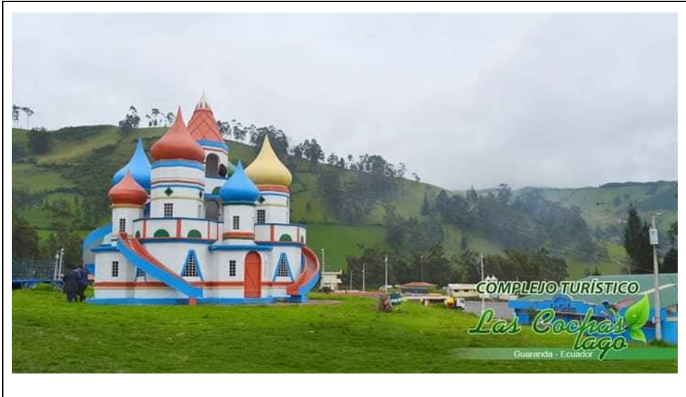
Figura N° 2 Complejo Turístico Lago las Cochas

piscina, turco, hidromasaje, polar y demás servicios de entretenimiento y relajación, además cuenta con amplias cabañas donde se puede organizar parrillada familiares y entre amigos.